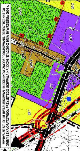
WYKYS ZE STUDIUM UMWARIKOWANI I KIERUNKOW ZAGOSPODAROWANIA PRZESTRZENNEGO GMINY ŁĘKA OPATOWSKA PRZEZ DELEG. ICHWAŁA W AKTACH Z 2009 Z DNIA 30 WRZEŚNIA 2009 R.