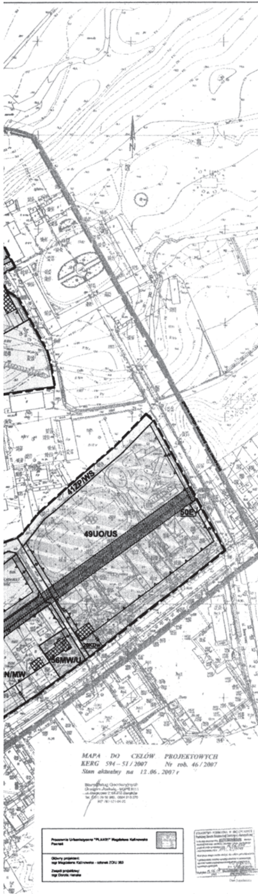
MAPA DO CEŁÓW PROJEKTOWYCH KERG 594 - 51 / 2007 Nr rob. 46 / 2007 Stan aktualny na 12.06.2007 r.

Wykonanie: Ochrony i Droga, Józefów, 60-203 811 ul. Wolności 7, 60-203 811 tel. 061 42 10 980, 061 42 10 270 061 42 10 980