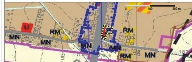
Wyrzys z Studium Uwarunkowań i kierunków zagospodarowania przestrzennego gminy Prószków (Uchwała Nr III/13/2014 Rady Miejskiej w Prószkowie z dnia 16 grudnia 2014 r.)