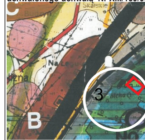
Wrys z studium uwarunkowań i kierunków zagospodarowania przestrzennego gminy Mszana Dolna uchwalonego uchwałą Nr XIII/139/99 Rady Gminy Mszana Dolna z dnia 29 grudnia 1999r. (z późn.zm.)