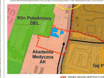
GRANICE OBSZARU OBJĘTEGO PLANEM