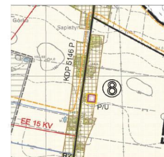
P/U TERENY OBIEKTÓW PRODUKCYJNYCH, SKŁADÓW I MAGAZYNÓW Z ZABUDOWĄ USŁUGOWĄ