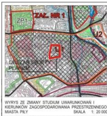
WYRYS ZE ZMIANY STUDIUM UWARUNKOWAŃ KIERUNKÓW ZAGOSPODAROWANIA PRZESTRZENNEGO MIASTA PIŁY SKALA 1: 20 000