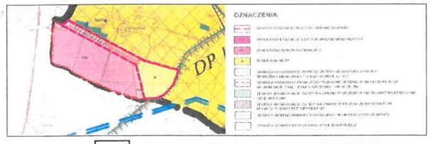
WYRYS ZE ZMIANY STUDIUM UWARUNKOWAŃ I KIERUNKÓW ZAGOSPODAROWANIA PRZESTRZENNEGO GMINY CHMIELNIK