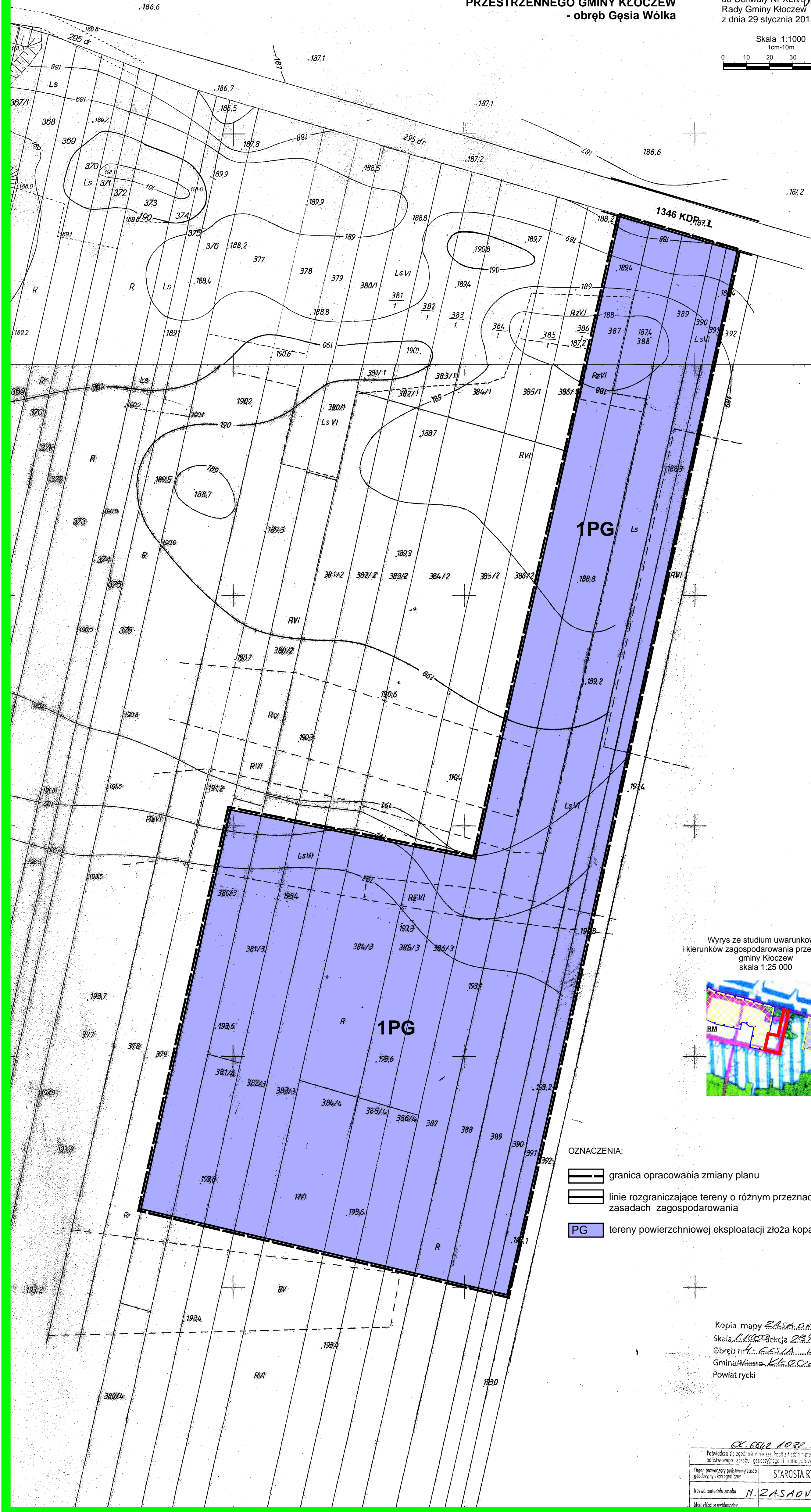
Wyrzys ze studium uwarunkowań i kierunków zagospodarowania przestrzennego gminy Kłoczew skala 1:25 000