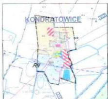
Wykres zmiany studium uwarunkowań i kierunków zagospodarowania przestrzennego Gminy Kondratowice (Uchwała Nr XXIV/2011 Rady Gminy Kondratowice z 08 czerwca 2011 r.) skala 1:20000

Niniejszy rysunek planu stanowi załącznik nr 1 do Uchwały Nr XLII/223/2014 Rady Gminy Kondratowice z dnia 30 stycznia 2014 roku