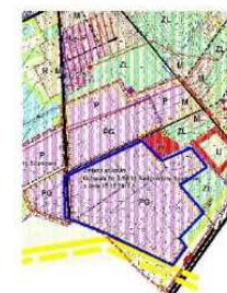
TERENY OBJĘTE OPIACOWANIEM