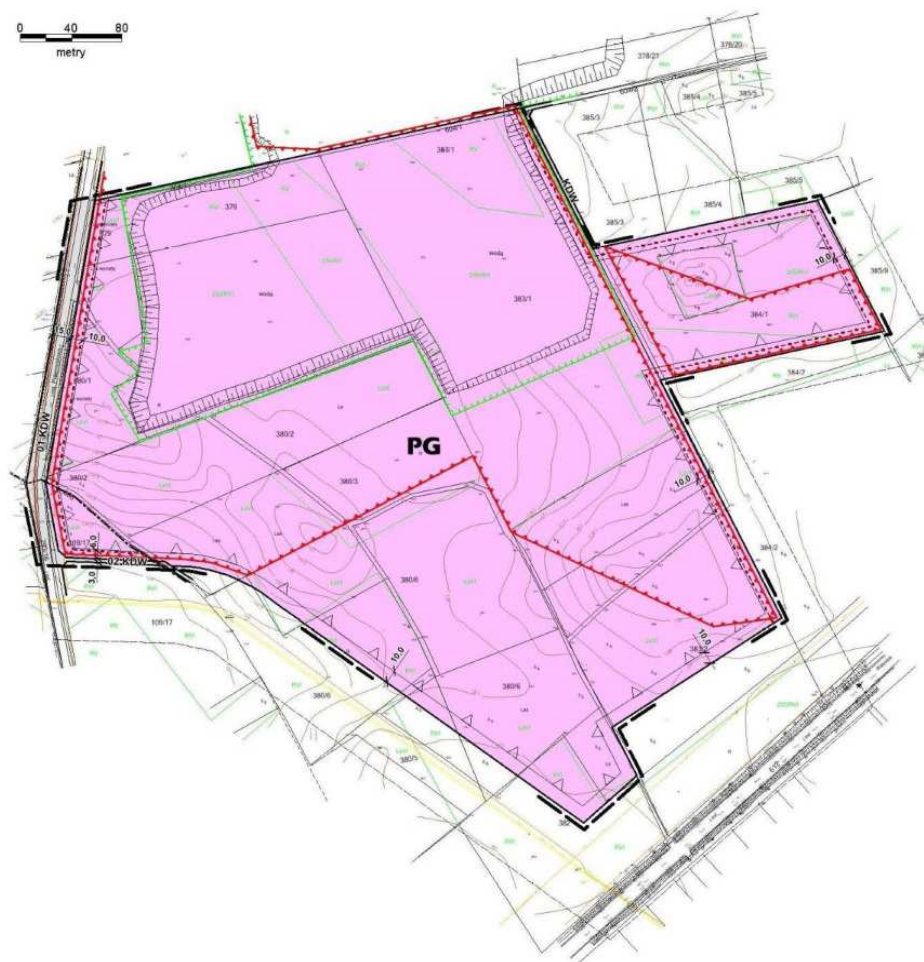
WYRYS ZE STUDIUM UWARUNKOWAŃ I KIERUNKÓW ZAGOSPODAROWANIA PRZESTRZENNEGO GMINY SZUMOWO