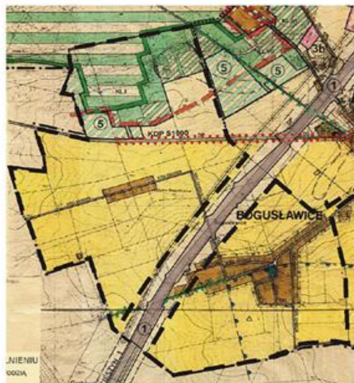
MIJSCOWY PLAN ZAGOSPODAROWANIA PRZESTRZENNEGO GMINY KRUSZYNA sołectwo BOGUSŁAWICE