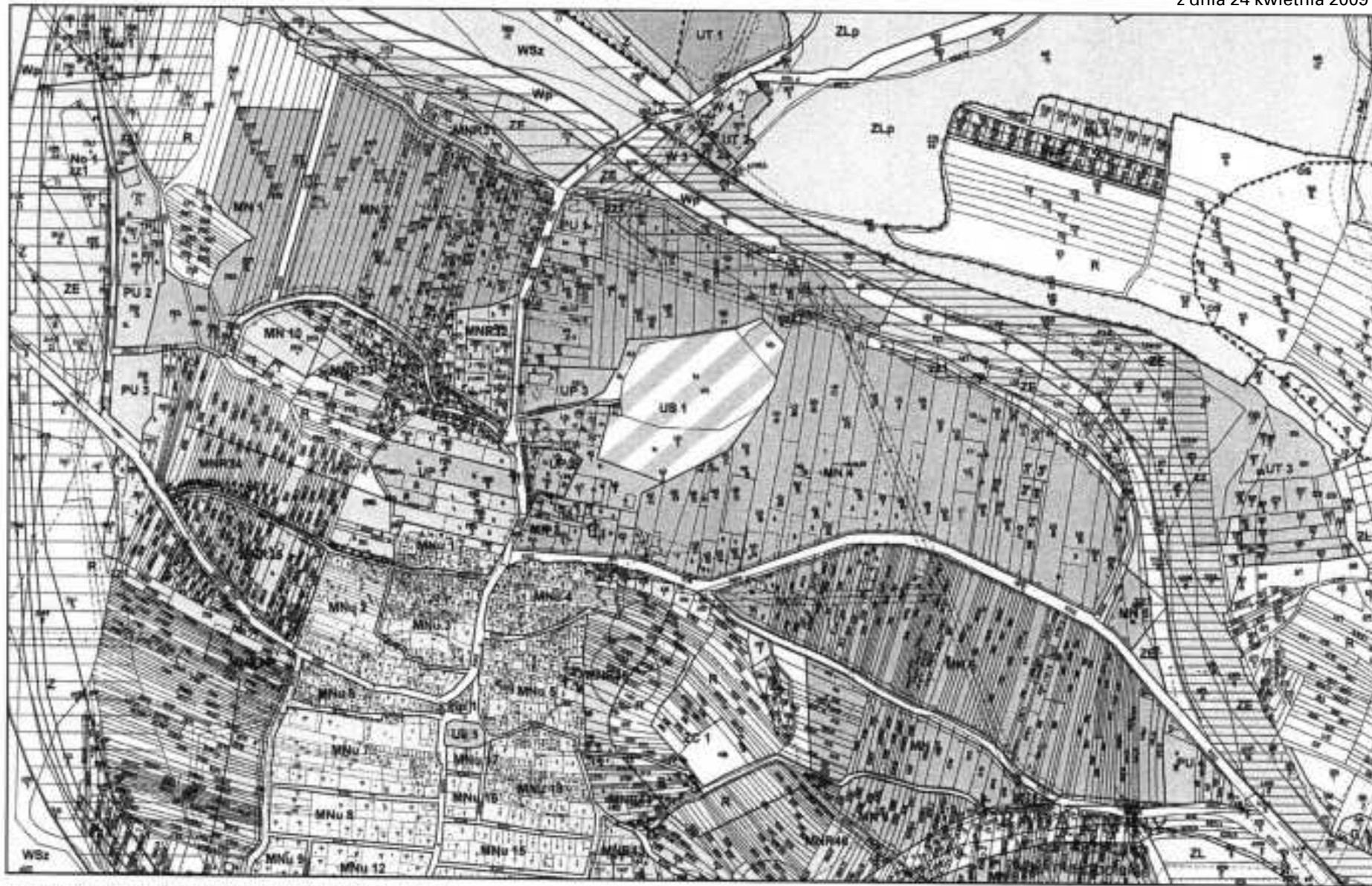
MIEJSCOWY PLAN ZAGOSPODAROWANIA PRZESTRZENNEGO WIEŚ ZEMBRZYCE GMINA ZEMBRZYCE

SKALA 1 : 2000 0 10 20 30 40 50 60 70 80 90 100