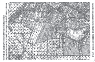
Wzrost 20. Studium uwarunkowań i kierunków zagospodarowania przestrzennego gminy Puszczykowo