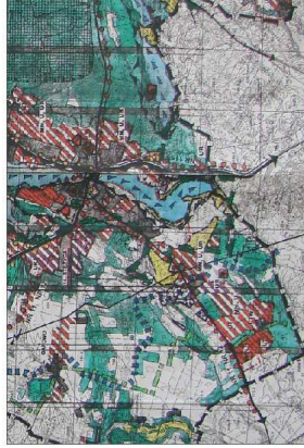
ZMIANA MIEJSCOWEGO PLANU ZAGOSPODAROWANIA PRZESTRZENNEGO DLA OBRĘBU STEŻYCZA A050-USR SKALA 1:2000

WYRYS ZE STUDIUM UWARUNKOWAŃ I KIERUNKÓW ZAGOSPODAROWANIA PRZESTRZENNEGO GMINY STEŻYCZA