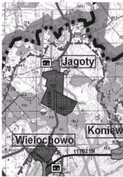
WYRYS ZE STUDIUM UWARUNKOWAŃ I KIERUNKÓW ZAGOSPODAROWANIA PRZESTRZENNEGO GMINY LIDZBARK WARMIŃSKI SKALA 1 : 25000