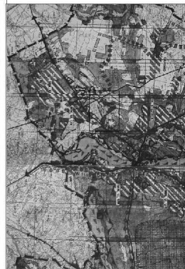
ZMIANA MIEJSCOWEGO PLANU ZAGOSPODAROWANIA PRZESTRZENNEGO DLA OBRĘBU STĘŻYCA DLA TERENU OZNACZONEGO SYMBOLEM B031 UK SKALA 1:2000

WYRYS ZE STUDIUM WYKONKOWANI I NERJUNKOW I NERJUNKOW ZAGOSPODAROWANIA PRZESTRZENNEGO GMINY STĘŻYCA