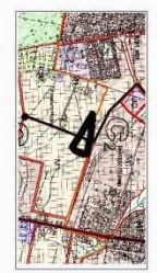
— GRANICE OBSZARU OBJĘTEGO PLANEM

ZALĄCZNIK NR 1 DO UCHWAŁY NR XX/50/2011 RADY MIASTA SWARĘDZU Z DNIA 29 MARCA 2011 R.