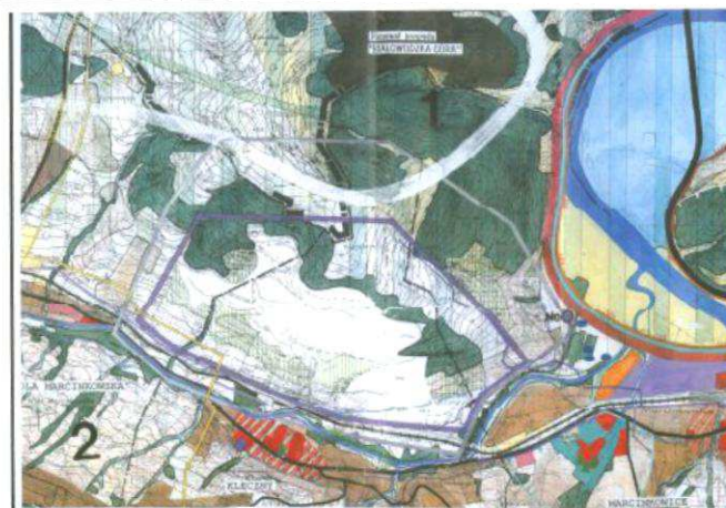
Wyrys z obowiązującego "Studium uwarunkowań i kierunków zagospodarowania przestrzennego Gminy Chelmiec" zatwierdzonego Uchwałą Nr LX(339)98 z dnia 23 kwietnia 1998 roku