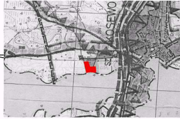
WYRYS ZE STUDIUM UWARUNKOWAŃ I KIERUNKÓW ZAGOSPODAROWANIA PRZESTRZENNEGO GMINY MRĄGOWO