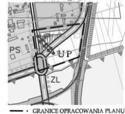
GRANICE OPRACOWANIA PLANU