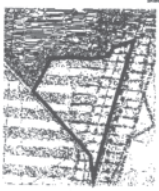
graniczka opracowania planu

Wyrzys ze Studium uwarunkowań i kierunków zagospodarowania przestrzennego gminy Budzylńi zabiegającego uchwałą nr 700/09 Rady Gminy Budzylń z dnia 9 listopada 1999 r.