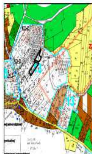
Wyrus studium Gminy Dreżdenko z granicą MPZP skła 1 : 10 000