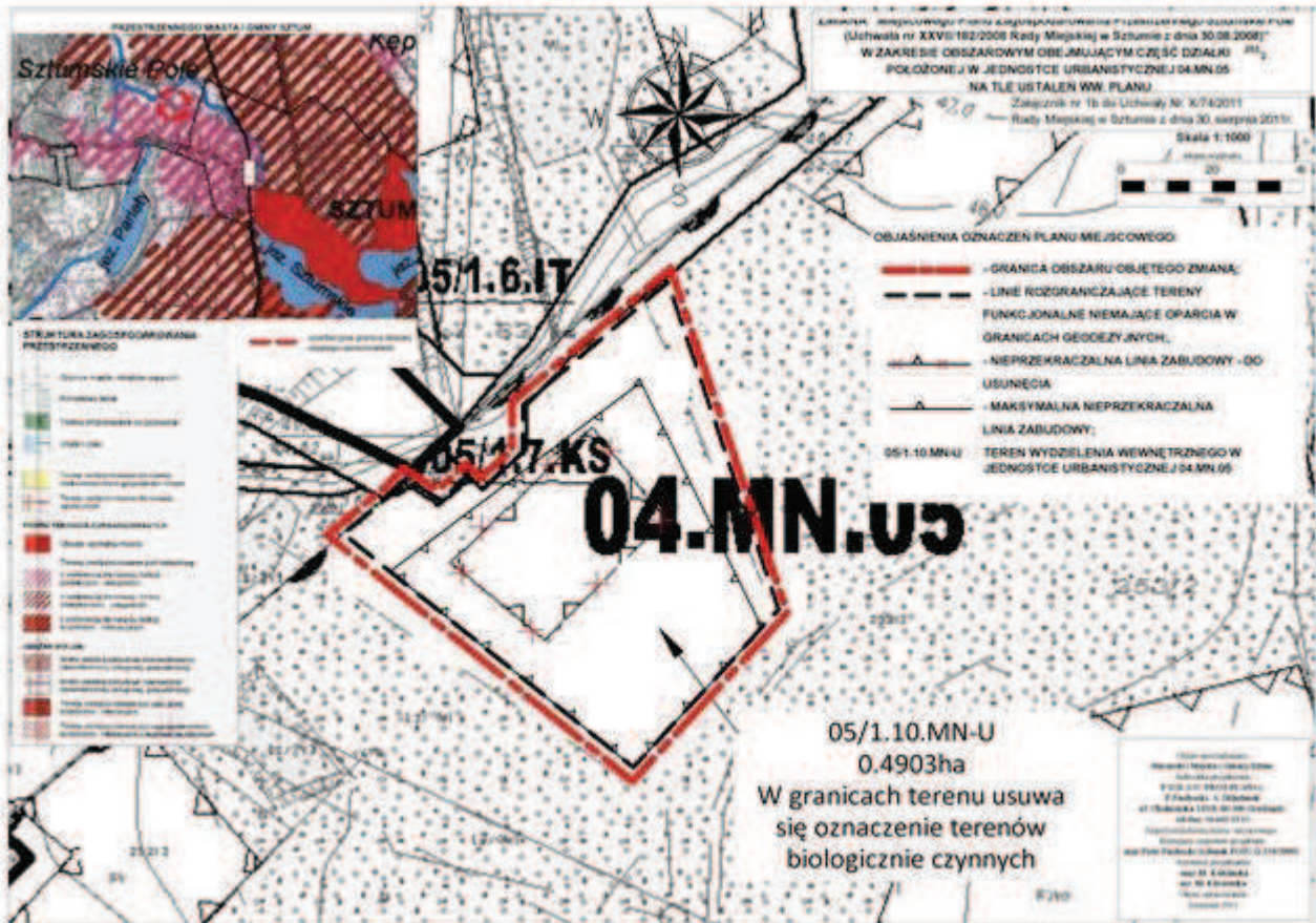
3) Załącznik Nr 1 c – przedstawiający graficzne ustalenia niniejszej zmiany wykonany na kopii mapy zasadniczej w skali 1:1000.