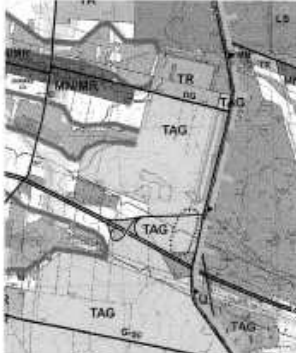
STUDIUM GM. STARE MIASTO UCHWALONE UCHWAŁĄ NR XXXII/234/2005 RADY GMINY STARE MIASTO Z DNIA 25 MAJA 2005r.