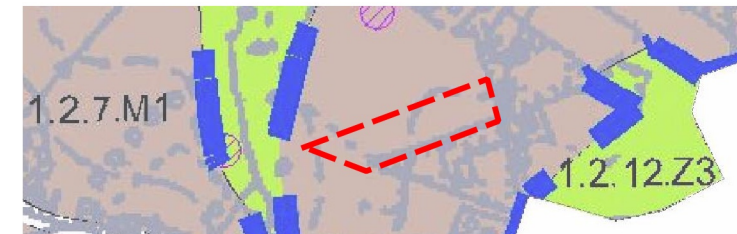
WYRYS ZE STUDIUM UWARUNKOWAŃ I KIERUNKÓW ZAGOSPODAROWANIA PRZESTRZENNEGO MIASTA MIKOŁOWA SKALA 1 : 5 000

GRANICA OBSZARU OBJĘTEGO PLANEM MIEJSCOWYM