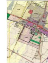
FRAGMENT STUDIUM UWARUNKOWAŃ I KIERUNKÓW ZAGOSPODAROWANIA PRZESTRZENNEGO GMINY STRZAŁKOWO GRANICA OBSZARU OBJĘTEGO PLANEM