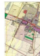
FRAGMENT STUDIUM UWARUNKOWAŃ I KIERUNKÓW ZAGOSPODAROWANIA PRZESTRZENNEGO GMINY STRZAŁKOWO ----- GRANICA OBSZARU OBJĘTEGO PLANEM

STRZAŁKOWO - AL. PRYMASA WYSZYŃSKIEGO MIEJSCOWY PLAN ZAGOSPODAROWANIA PRZESTRZENNEGO DLA WYBRANYCH TERENÓW SKALA 1:1000 ZAŁĄCZNIK NR 2 DO UCHWAŁY NR XXXI/212/2017 RADY GMINY STRZAŁKOWO Z DNIA 25.05.2017 R.