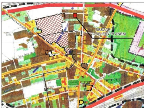
WYRYS ZE STUDIUM UWARUNKOWAŃ I KIERUNKÓW ZAGOSPODAROWANIA PRZESTRZENNEGO MIASTA I GMINY KRZYŻ WLKP. SKALA 1: 10 000