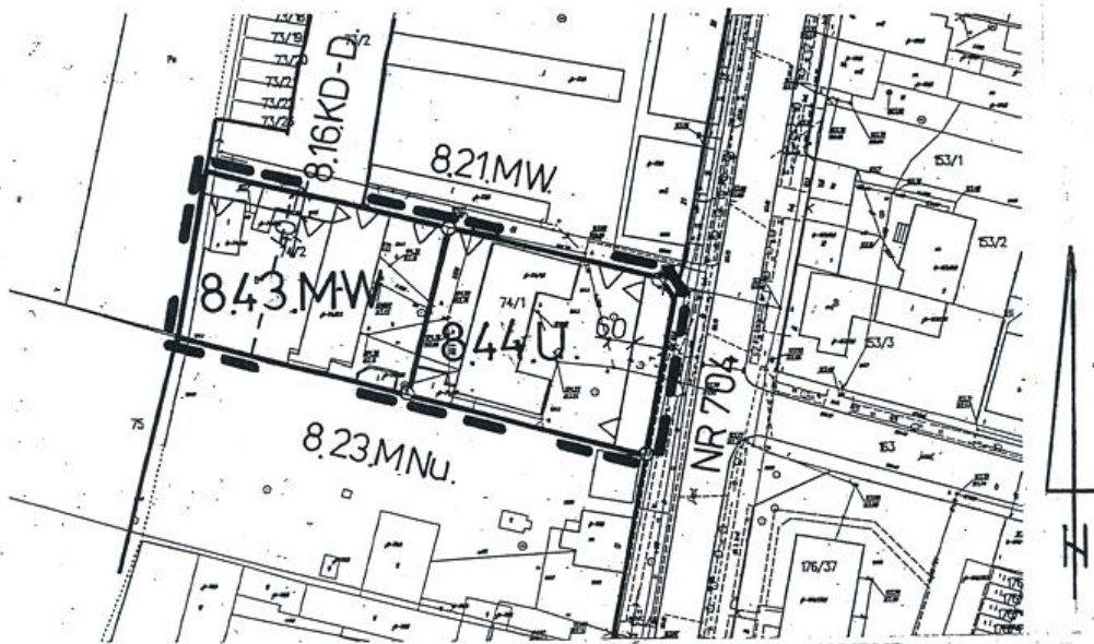
WYRYS z rysunku studium uwarunkowań i kierunków zagospodarowania przestrzennego Gminy Łyszkowice Skala 1 : 10 000 — — — granice obszaru objętego rysunkiem planu miejscowego

STAROSTA ŁOWICKI Powiatowy Ośrodek Dokumentacji Geodezyjnej i Kartograficznej w Łowiczu Poświadczam zgodność niniejszej mapy z oryginałem przyjętym do państwowego zasobu geodezyjnego i kartograficznego w dniu ..... i zarejestrowanym pod nr. 707/2014 Niniejsza mapa nie może służyć celom innym niż projektowych