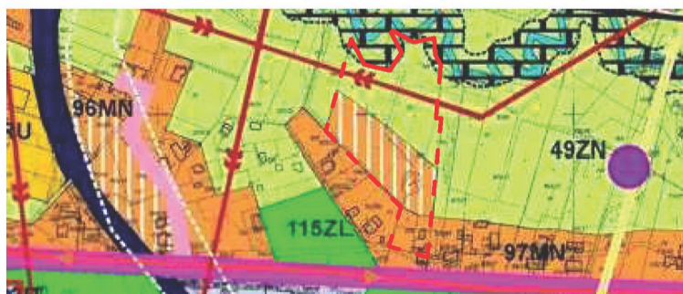
GRANICA OBSZARU OPRACOWANIA PLANU SKALA 1 : 5000