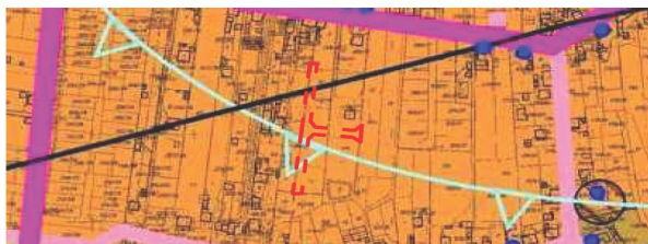
GRANICA OBSZARU OPRACOWANIA PLANU SKALA 1 : 5000