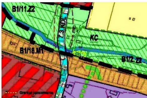
WYRYS ZE STUDIUM UWARUNKOWAŃ I KIERUNKÓW ZAGOSPODAROWANIA PRZESTRZENNEGO MIASTA ZIELONA GÓRA