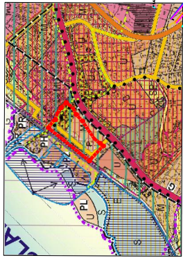
WYRSZĘZNIUMIARUNKOWANI KIERUNKÓW ZAGOSPODAROWANIA PRZESTRZENNEGO M. FROMBORKA