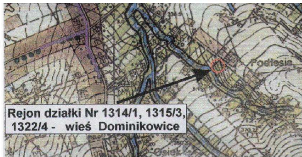
Rejon działki Nr 1314/1, 1315/3, 1322/4 - wieś Dominikowice