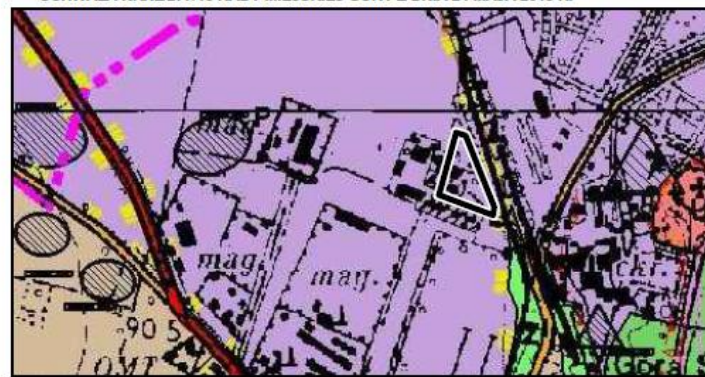
GRANICA OBSZARU OBJĘTEGO ZMIANĄ PLANU MIEJSCOWEGO

WYRYS ZE STUDYUM UWARUNKOWAŃ I KIERUNKÓW ZAGOSPODAROWANIA PRZESTRZENNEGO GMINY GÓRA, UCHWAŁA NR XL/277/13 RADY MIEJSKIEJ GÓRY Z DNIA 24 MAJA 2013 R.