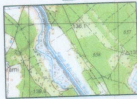
ORIENTACJA skala 1 : 50000

województwo: pomorskie powiat: Kościerzyna gmina: Karsin obręb: BORSK działka: 682 sekcja m. zas.: 6.211.20.8.4.1