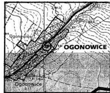
Wyrys ze studium uwarunkowań i kierunków